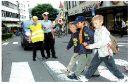
Zusammen sind wir stark!